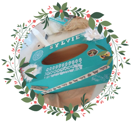
Atelier art floral à Cappelle la Grande le 24/09/21 : confection de boîtes de mouchoirs