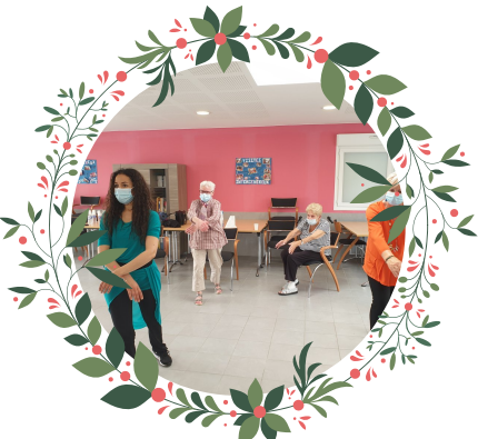
Atelier prévention sénior, danse orientale 16/07/2021