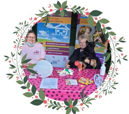
Comme chaque année, l'ADAR a tenu un stand lors de la Fête de la nature à Coudekerque-Branche les 11 et 12/09/21