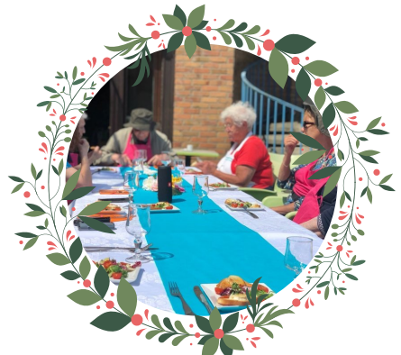
Atelier O'saveur au Val des Roses octobre 2021