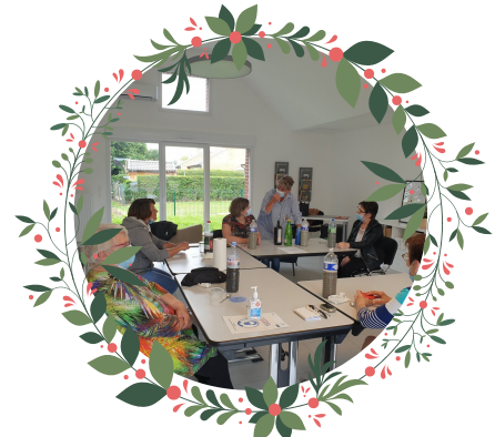
Atelier Bien-Etre animé par France à Escquelbecq le 24/06/2021